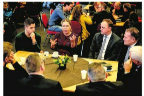
Minister Schouten was in februari 2019 op Urk om met vissers te praten over de toekomst van de pulsvisserij.