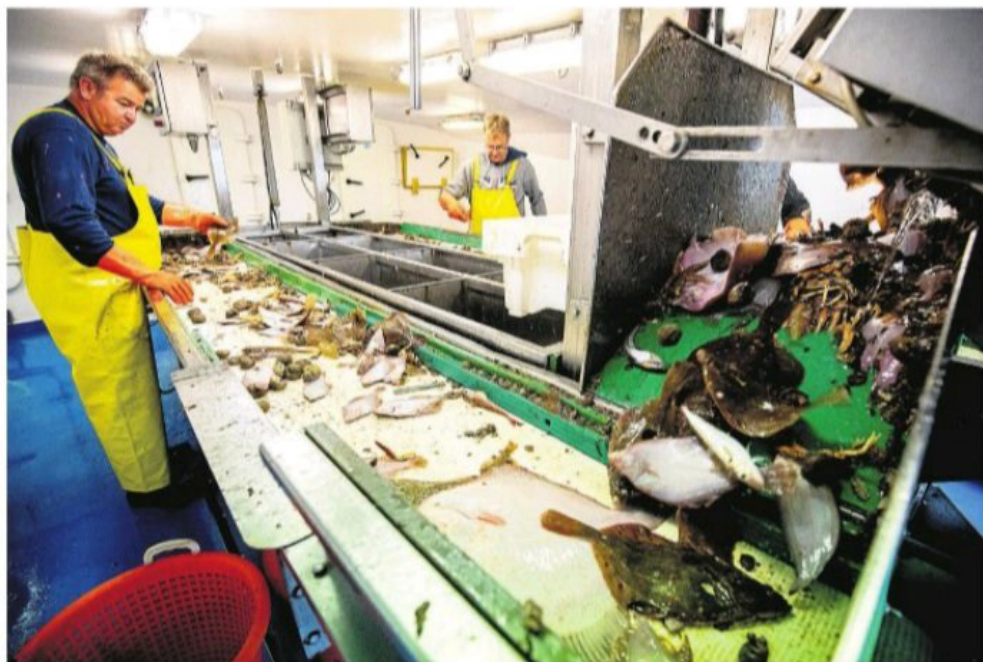
Vissers verwerken de vangst op de koter TX-38.

Intussen neemt het verzet tegen de pulsvisserij toe. Gematigde