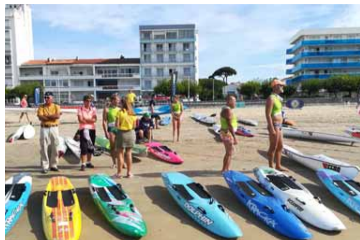
Les épreuves du championnat ont lieu sur le sable et en mer.

Le sauvetage sportif se décline sur deux terrains de jeu en bord de mer avec le sauvetage côtier et en eau plate. « La Fédération française de sauvetage et de secourisme est sous l'égide de deux ministères. Sous celui des sports en ce qui concerne son volet sportif et sous celui de l'intérieur pour son volet secourisme. La fédération gère en effet des postes de secours, l'été, sur les plages. Nous sommes aussi présents sur de grands événements comme les 24 Heures du Mans, par exemple. Nous nous occupons du secou-