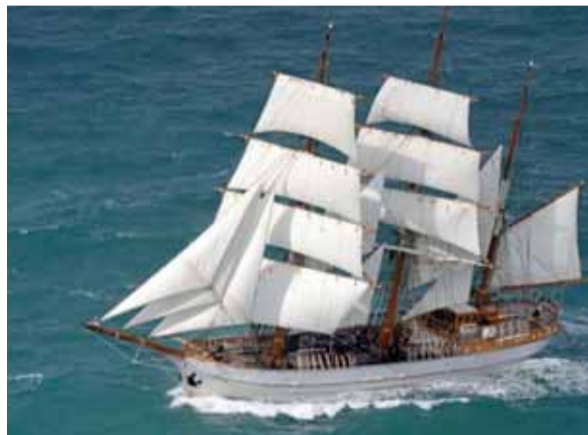
Le trois-mâts « Le Français », attendu samedi.

Trois navires remarquables animeront les escales du port de plaisance de La Rochelle ces prochains jours. Tout d'abord, le trois-mâts de 37 mètres « Le Français », à partir de samedi jusqu'au 2 ou 3 octobre. Il sera suivi le 18 septembre pour une escale de quatre jours du « El Galeo Andaluçia », réplique d'un galion espagnol du XVI e siècle. Et pour clôturer ce défilé de jolies coques viendra la frégate russe « Shtandart », désormais habituée du port, du 20 au 30 octobre. Tous accosteront dans le bassin des Chalutiers.