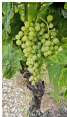
ILLUSTRATION ANNE LACAUD

La semaine dernière, la station viticole du BNIC (Bureau national interprofessionnel du cognac) précisait la date des vendanges en pariant sur la mi-septembre. Une nouvelle note des ingénieurs agronomes publiée lundi valide cette hypothèse. « Il serait opportun de commencer à vendanger dès la mi-septembre pour de nombreuses situations », écrivent les spécialistes.