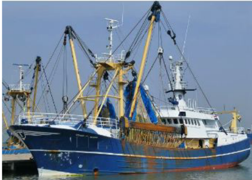
Buques arrastreros con sistema electro-dredge incorporado