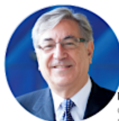
Karmenu Vella Commissioner EU Environment, Maritime Affairs and Fisheries

Por otra parte, han enviado otra misiva al Comisionado de Pesca, Karmenu Vella, para que concluya las negociaciones del trilogó - del Consejo, del Parlamento y de la Comisión Europea- para impulsar la prohibición de la pesca eléctrica para el 31 de julio de 2019. EFEverde