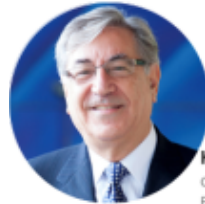
Karmenu Vella Commissioner EU Environment, Maritime Affairs and Fisheries

Por otra parte, han enviado otra misiva al Comisionado de Pesca, Karmenu Vella, para que concluya las negociaciones del trío -del Consejo, del Parlamento y de la Comisión Europea- para impulsar la prohibición de la pesca eléctrica para el 31 de julio de 2019. EFEverde