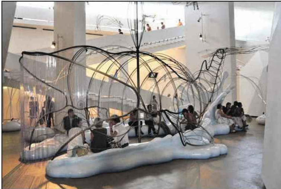
La Cité de l'Océan de Biarritz n'a pas encore conquis le public qu'elle mérite.