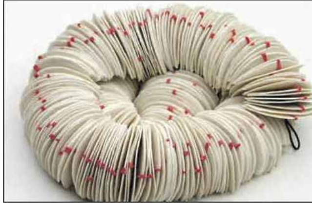
Vingt artistes à découvrir à Hendaye, ce week-end.