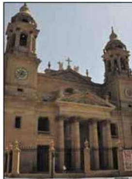
Derrière la façade baroque de la cathédrale de Pampelune se cachent des trésors.